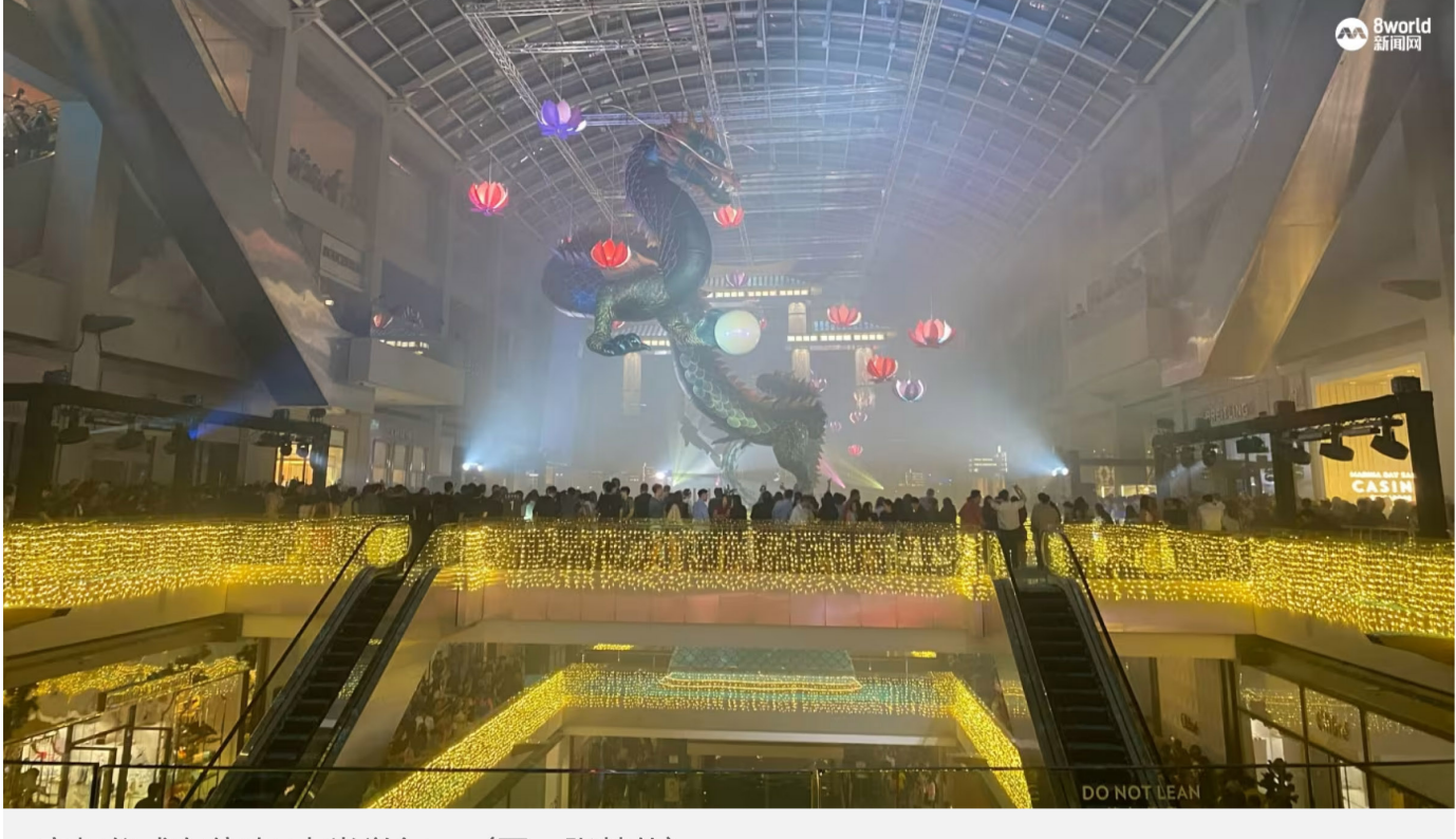
亮灯仪式在傍晚7点半举行。

文: 张慧仙 发布:06/02/2024 22:56 更新: 21小时前 ☆ 收藏